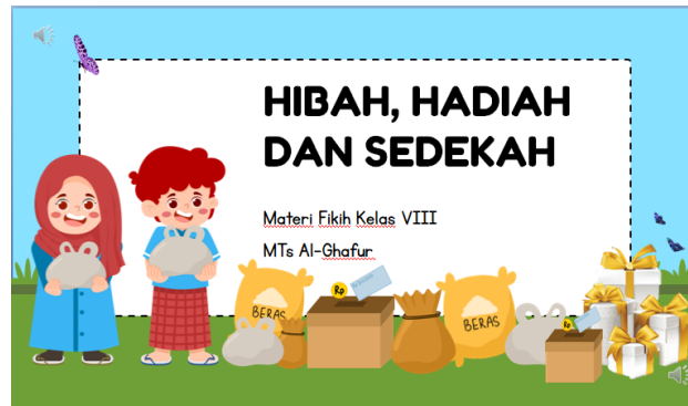
Gambar 1. Cover video