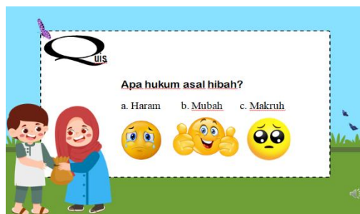
Gambar 3. Penutup

Quis, pada slide ini menyajikan sebuah pertanyaan untuk mengevaluasi pemahaman siswa. Slide ini pada tampilan video gambar emoji tidak muncul terlebih dahulu setelah siswa mengklik jawabannya maka emot tersebut akan muncul menggambarkan ekspresi yang benar akan tersenyum dan yang salah ekspresi sedih. Dilengkapi juga dengan sound efeknya. Serta Ucapan terimakasih, pada slide ini berisi ucapan doa “semoga bermanfaat” dan ucapan “terimakasih” karena telah menyimak penjelasan dari awal sampai akhir.