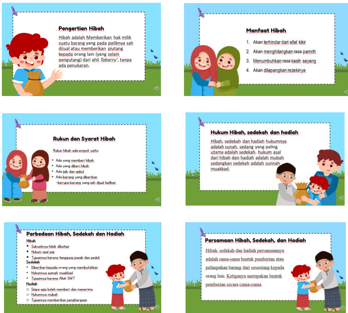
Gambar 2. Kegiatan inti

pada slide ini akan menjelaskan mengenai, pengertian, manfaat, Hukum dan ketentuan, rukun dan syarat, perbedaan dan persamaan, serta cara mempraktikkan.